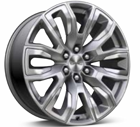
22인치 폴리쉬드 투톤 알로이 휠