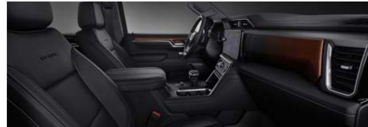
젯 블랙 인테리어 (Denali 전용)