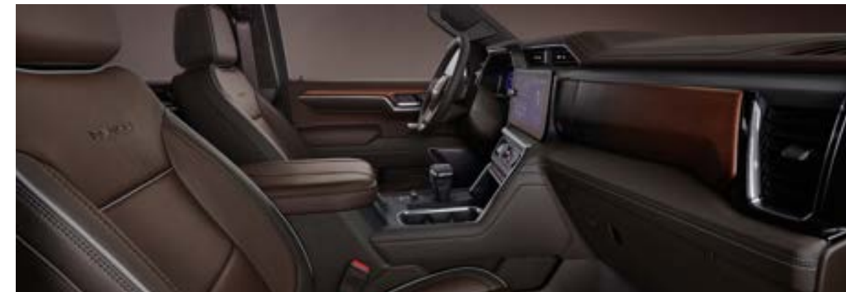
브라운스톤 인테리어 (Denali-X 전용)