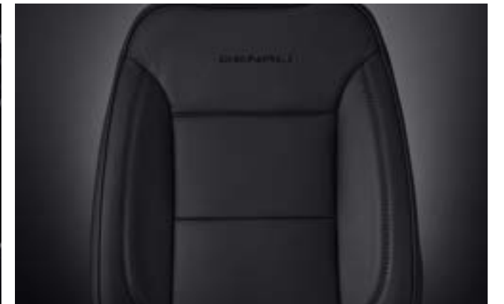
젯 블랙 천공 천연 가죽 시트