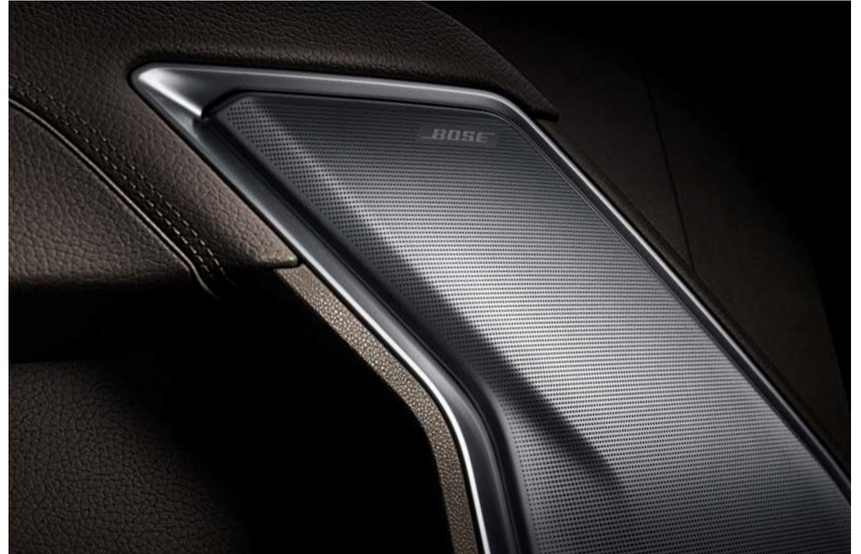
프리미엄 BOSE® 사운드 (Richbass™ 우퍼/앰프/7스피커)는 실내 어느 좌석에서도 최상의 음질을 제공합니다.