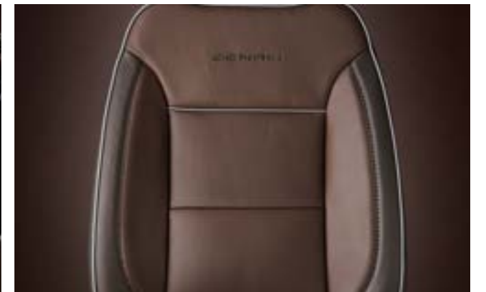
브라운스톤 천공 천연 가죽 시트