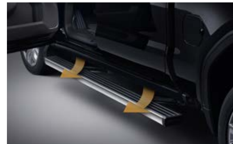
일반 전개 위치

3 포지션 멀티프로 파워 스텝은 편리한 탑승과 적재함에서의 작업이 모두 용이하도록 설계되었습니다. 승하차시 작동하는 전동 사이드 스텝의 한계를 뛰어 넘어 스텝 후측면 킥 스위치를 통해 적재함까지 이동하는 기술로 GMC 시에라만의 차별화된 편리함을 느끼실 수 있습니다.