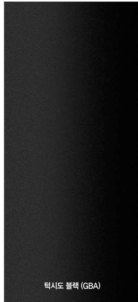
텍시도 블랙 (GBA)