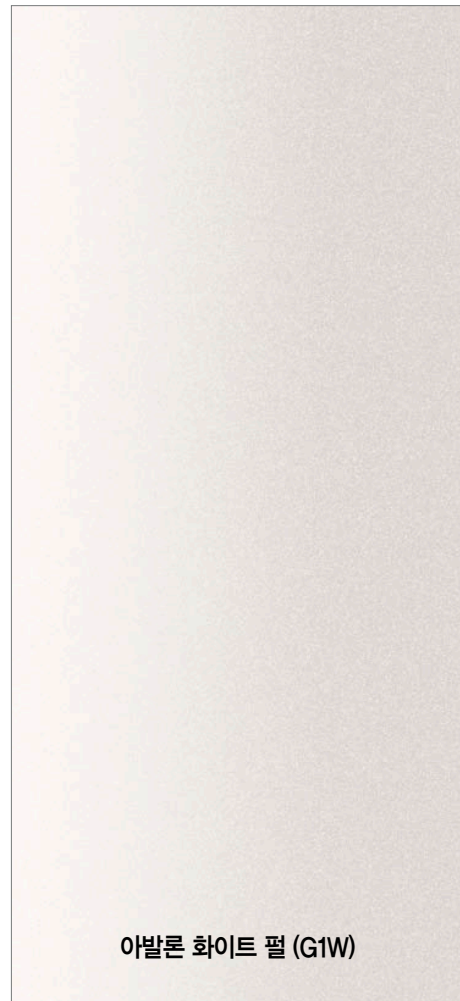
아발론 화이트 풀 (G1W)