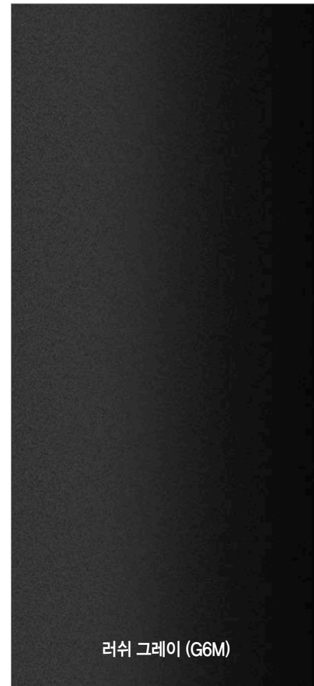
러쉬 그레이 (G6M)