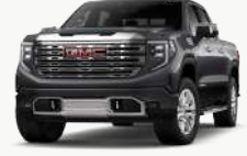
러쉬 그레이 [G6M]

* Denali 선택 가능 외장 컬러 : 아발론 화이트 펄 (G1W), 텍시도 블랙 (GBA)