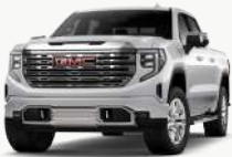
아발론 화이트 펄 [G1W]