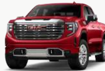
볼케이노 레드 [GNT]