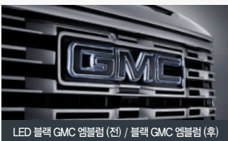
LED 블랙 GMC 엠블럼 (전) / 블랙 GMC 엠블럼 (후)