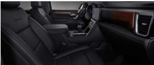
젯 블랙 인테리어