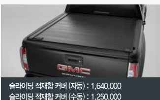
슬라이딩 적재함 커버 (자동) : 1,640,000 슬라이딩 적재함 커버 (수동) : 1,250,000