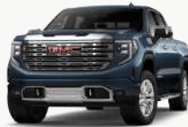
퍼시픽 블루 [GAO]