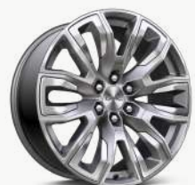
22인치 폴리쉬드 투톤 알로이 휠

* Denali 트림 선택 시, 젯 블랙 인테리어 자동 적용. (브라운 스톤 인테리어 선택 불가) * Denali-X 트림 선택 시, 브라운 스톤 인테리어 자동 적용. (젯 블랙 인테리어 선택 불가)