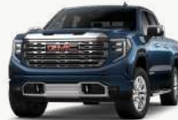
인디고 블루 [GXP]