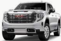
아발론 화이트 펠 [G1W]