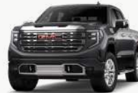
러쉬 그레이 [G6M]

* Denali 선택 가능 외장 컬러 : 아발론 화이트 펠 (G1W), 텍시도 블랙 (GBA) * Denali-X는 모든 외장 컬러 선택 가능