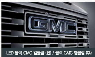
LED 블랙 GMC 엠블럼 (전) / 블랙 GMC 엠블럼 (후)