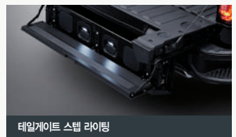
테일게이트 스텝 라이팅