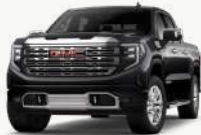
텍시도 블랙 [GBA]