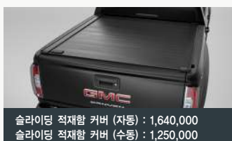
슬라이딩 적재할 커버 (자동) : 1,640,000 슬라이딩 적재할 커버 (수동) : 1,250,000