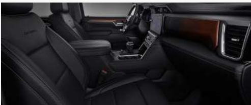
젯 블랙 인테리어