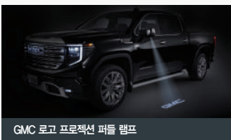
GMC 로고 프로젝션 퍼들 램프