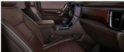
브라운 스톤 인테리어